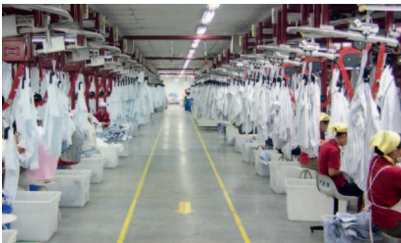
An den zwei nach OEKO-TEX® Standard 1000 zertifizierten Betriebsstätten in Guangdong sind insgesamt 29.800 Mitarbeiter beschäftigt. Die vom Zertifikat abgedeckten Bereiche sind die Spinnerei, Weberei, Garn- und Stückveredelung sowie die Konfektion der Baumwollhemden und Maschenware-artikeln wie T-Shirts, Polo-Shirts etc.

12/F, Harbour Centre 25 Harbour Road Wanchai | HONG KONG questions@esquel.com www.esquel.com